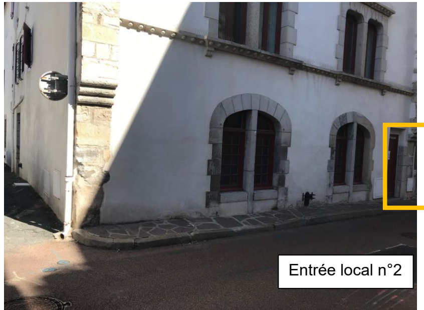
Entrée local n°2