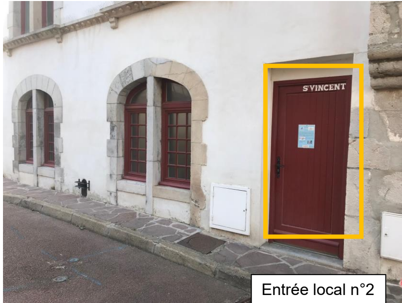
Entrée local n°2